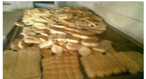
Pain prêt à être commercialisé