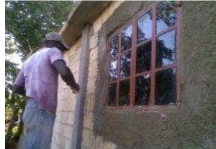
Pose des fenêtres