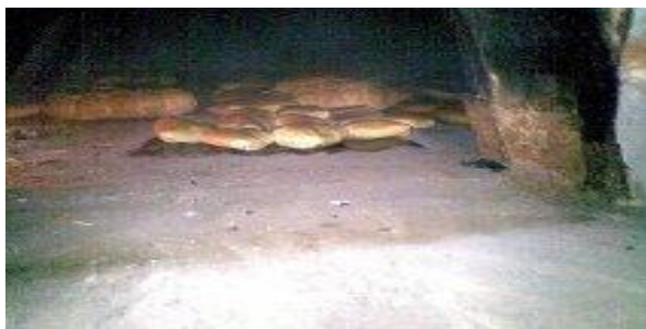
Pain pendant la cuisson