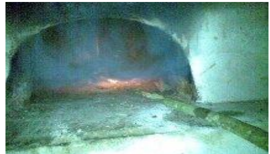
Le boulanger enfourne la pâte avec sa longue pelle